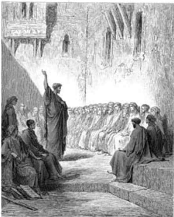
Sv. Pavol káže Solúnčanom, Gustave Doré

a ústnu. Písomná obsahovala 613 predpisov, ale ústna obsahovala viac. Písomná bola daná raz navždy, ústna bola odovzdávaná stáročia cez tradíciu. Písomná Tóra bola samozrejme dôležitejšia, ale mohla sa pochopiť len