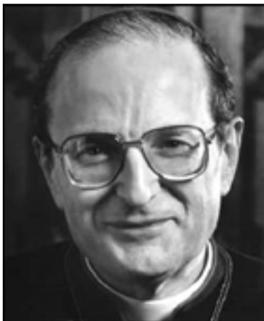
Kardinál Joachim Meisner, arcibiskup v Kolíne nad Rýnom