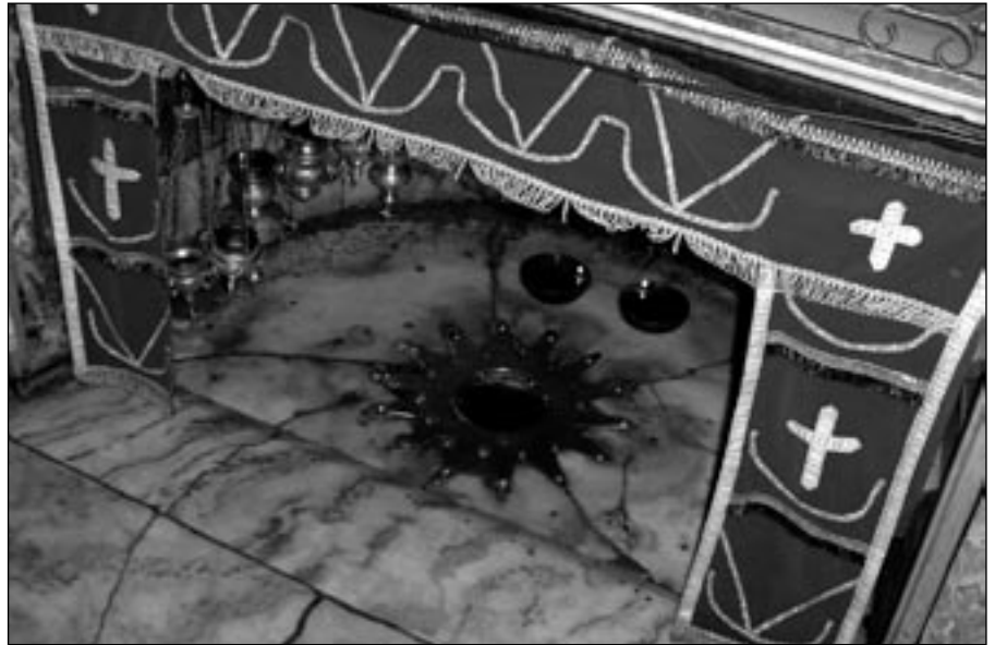
Miesto narodenia Krista

Kto sa chystá navštíviť miesta vo Svätej Zemi, ten nech si zväží, čo tam vlastne chce robiť. Chce si ich odfotiť? Nafilmovať na kameru? Prečítať si o nich presne na tom mieste? Modliť sa tam? Meditovať? Vychutnávať tú inakosť atmosféry? Nedá sa všetko