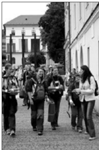
Mládež v uliciach Levoče