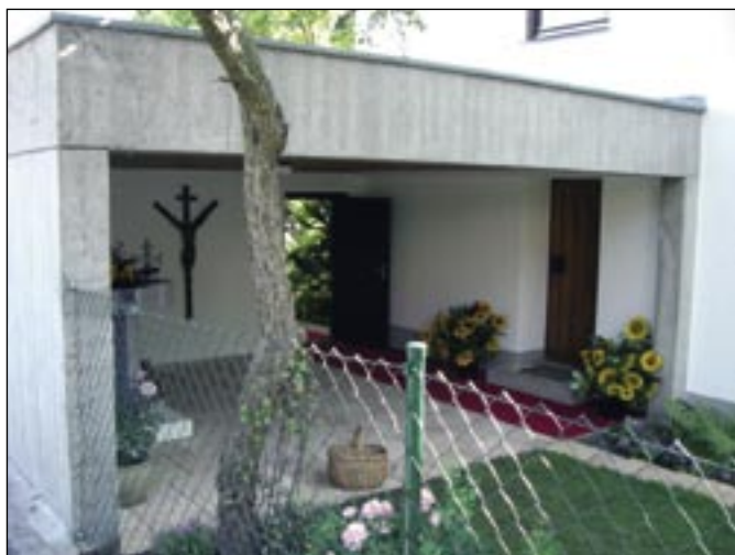
Križ z Levoče zdobí átrium pápežovho domu