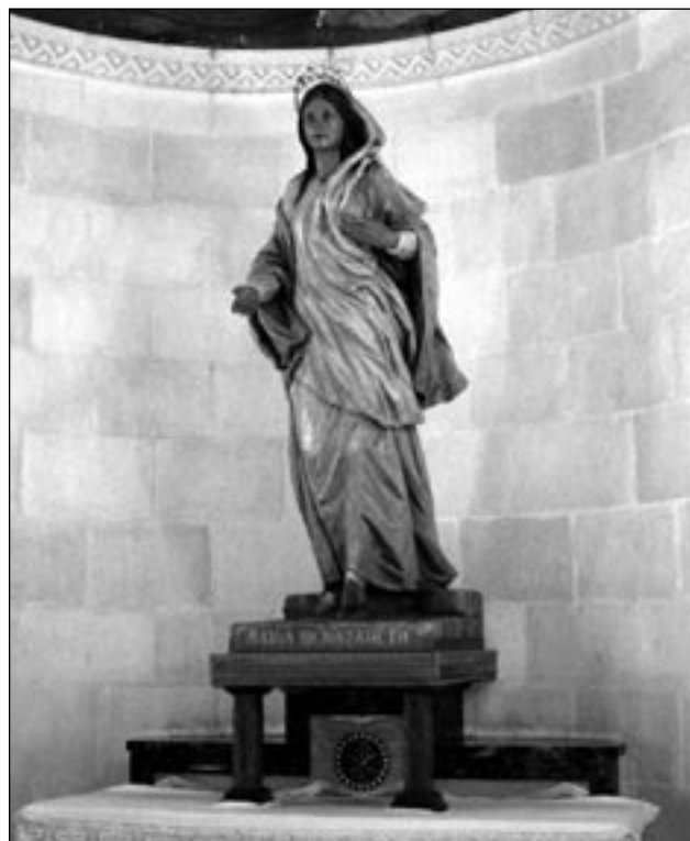
Socha Panny Márie v Nazarete

Počas dvoch týždňov ich pútnik navštívi veľmi veľa. Z toho veľkého počtu aspoň zopár: Kostol Navštívenia Panny Márie, kde prvýkrát predniesla Magnificat. Jaskynka, v ktorej sa Ježiš prvýkrát pomodlil Pater noster. Betánia – miesto vzkriesenia Lazara. Samuelova hrobka – miesto, na ktorom si Šalamún vyprosival múdrosť. Cesarea prímorská s úžasne veľkým a dobre vybudovaným amfiteátrom. Hora Preme-