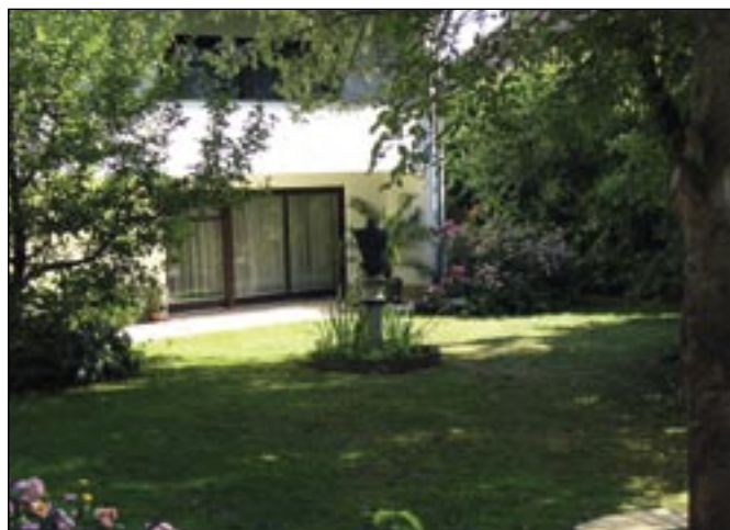
Pohľad do záhrady pápežovho domu v Pentligu