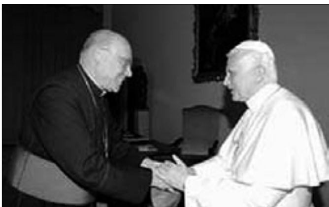
Joseph Wiliam Levada a Benedikt XVI.