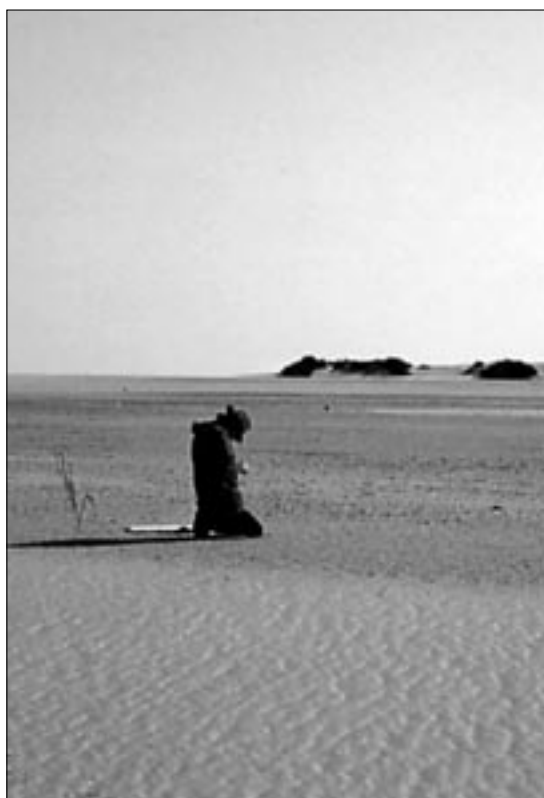
V samote púšte otvára človek srdce Bohu

Môj Bože, pomaly začínam chápať Tvoje požiadavky a rady. Vďaka! Tak nabudúce, áno?