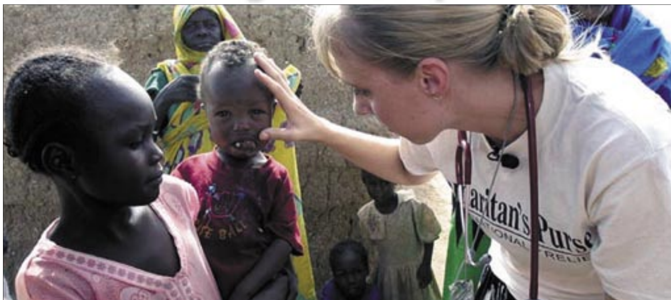
Lekárka Svetovej Zdravotníckej misie prezerá choré dieťa

Hoci už prešlo niekoľko týždňov od tragického leteckého nešťastia, ešte stále sa stretávame so situáciami, ktoré túto udalosť pripomínajú. A je to správne, keď si to pripomíname. Nielen preto, že niektorí z tragicky zosnulých boli z nášho blízkeho okolia, boli našimi blízkymi, známymi, spolužiakmi či žiakmi... Je veľmi dôležité pestovať v sebe schopnosť vnímať ľudí okolo seba ako spolupútnikov, o to zvlášť, keď ide o krajanov.