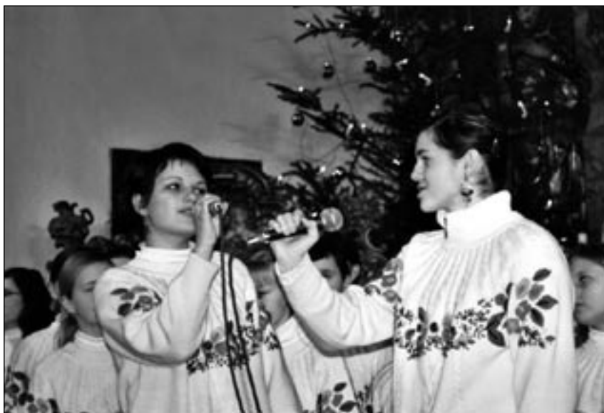
Vystúpenie speváckeho zboru Melódia v Markušovciach

Biblické texty sú bohaté na svedectvá o tomto duchovnom rozmere človeka. 309-krát svedčia starozákonné a 36-krát novozákonné texty o tom, že spev patrí do vzťahu medzi Bohom a človekom. Prvýkrát zaznieva biblická pieseň v okamihu vyslobodenia Izraela z Egypta (Ex 15, 1). Starozákonný kánon obsahuje osobitnú zbierku biblických piesní, knihu Žalmov. Okrem nej tu nájdeme i knihu Vělpieseň, zbierku najkrajšej hebrejskej ľubostnej poézie, kde sa nespomína slovo Boh, no práve táto „Pieseň piesní“ je najkrajším obrazom lásky Boha k človeku, keď sa Boh predstavuje ako ženich a Cirkev ako jeho milovaná nevesta. My však dobre vieme, že k pravej láske nepatrí len slepá zaľúbenosť, ale i vzájomná úcta,