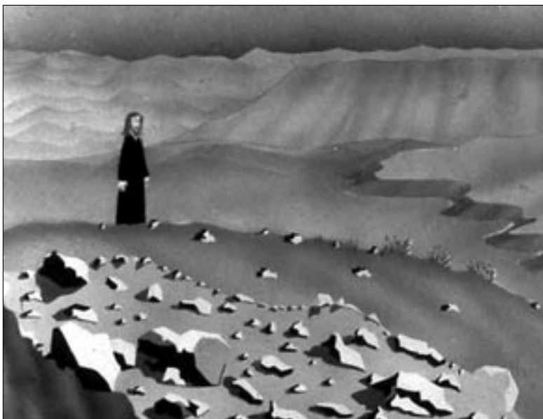
Ježiš na púšti (S. Abadie)

Na odmenu nezabudneme. Príspevky, ktoré uverejníme aj odmeníme.